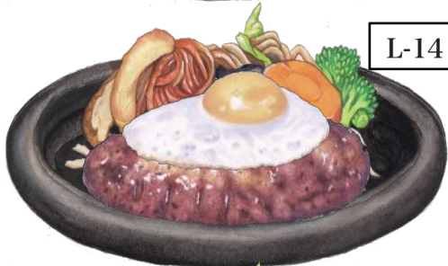
L-14 定番! 目玉焼きのハンバーグステーキランチ

<160g> ・・・ 税抜 1,082円 +200円でチーズに変更できます (税込1,190円)