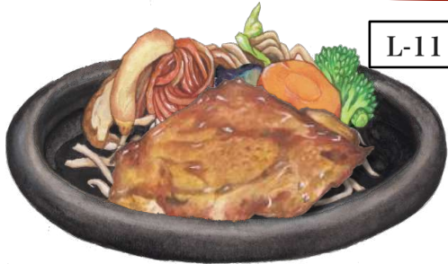
L-11 鶏もも肉のステーキランチ <230g>