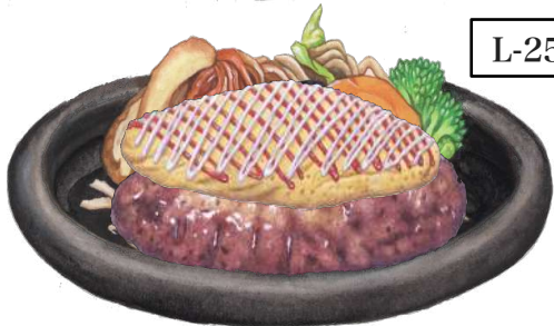
L-25 ふわとろオムレツのハンバーグステーキランチ