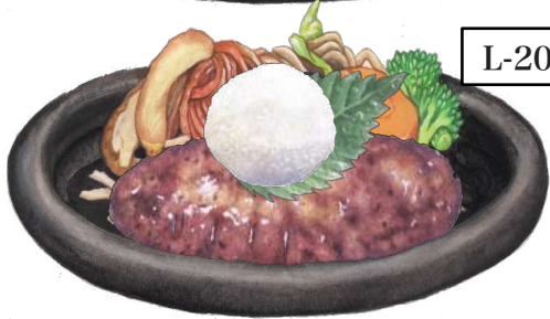
L-20 さっぱり大根おろしのハンバーグステーキランチ

<160g> ・・・ 税抜 1,082円 +200円でチーズに変更できます (税込1,190円)