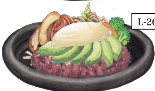
L-26 アボカドとWasabiマヨネーズのハンバーグステーキランチ